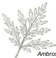
Ambrosia artemisiifolia Aufrechte Ambrosie

Anthemis tinctoria , Färber-Hundskamille; Tanacetum vulgare , Gemeiner Rainfarn