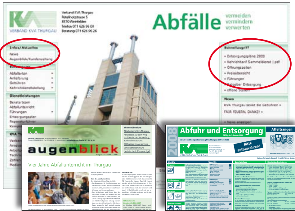
Auf der übersichtlichen Website der KVA Thurgau gelangt man schnell und direkt an alle Informationen.

Haben Sie einen «Augenblick» verpasst oder möchten Sie etwas in einer alten Ausgabe nachlesen? Kein Problem, unter Infos/Aktuelles können Sie unsere Informationszeitung jederzeit herunterladen – in einem Archiv ste-