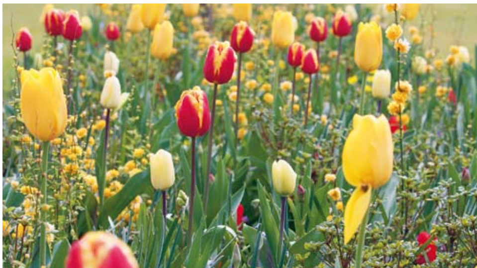
Kompost ist als Produkt des natürlichen Recyclings Dünger und Bodenverbesserer. Ob für Blumen, Gemüsebeete, Rasen oder Bäume – Kompost ist das Gold des Gärtners.