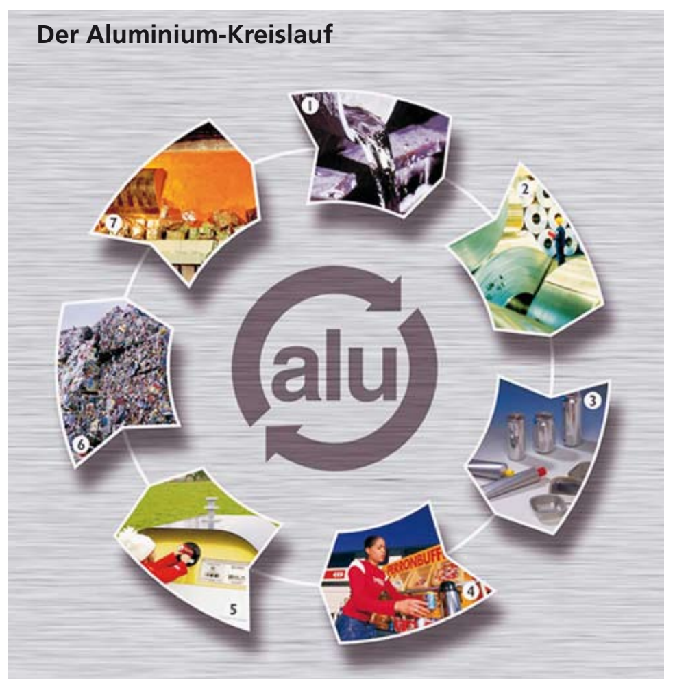
1. Flüssigaluminium 2. Aluminiumverarbeitung 3. Nahrungsmittelverpackungen aus Aluminium 4. Konsum 5. Aluminiumsammelstellen 6. Altstoffhandel 7. Recyclingprozess Aluminium