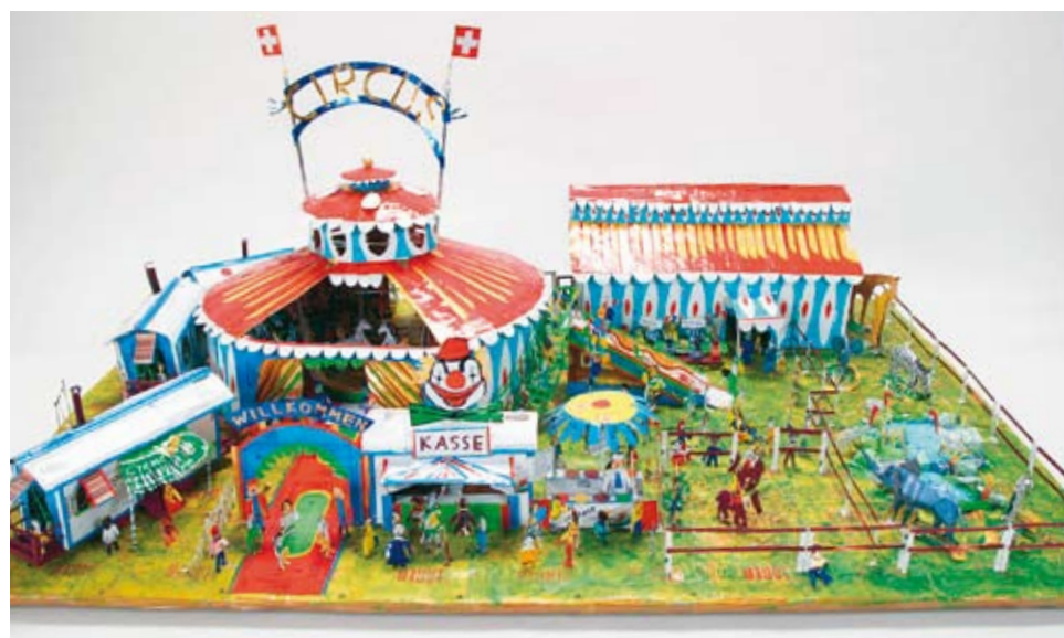
Das Werk von Severin Büeler aus Steinach trägt dem Namen «Hurra, der Zirkus ist da» und wurde beim Alu-Kreativ-Wettbewerb 2007 auf den dritten Platz gewählt.

So geht's: Einfach einen Wettbewerbstalon bestellen und diesen zusammen mit der Aluarbeit bis zum 15. Mai einsenden an: 3-D-Art, Bahnhofstrasse 16, 6014 Littau/Luzern Wettbewerbstalon erhältlich bei: IGORA-Genossenschaft für Aluminium-Recycling, Bellerivestrasse 28, 8034 Zürich oder auf www.igora.ch .