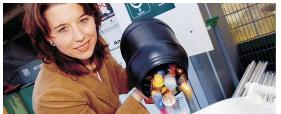
Der praktische Sammelbehälter für bis zu 200 Kapseln kann bei Nespresso bestellt werden.

Der Verband KVA Thurgau hat in Zusammenarbeit mit Nespresso und der IGORA (Genossenschaft für Aluminium-Recycling) diverse Sammelstellen für gebrauchte Nespresso-Kaffeekapseln eingerichtet. Spezielle weisse Behälter mit grüner Beschriftung warten dort auf die Kapseln. Wegen des grossen Erfolgs hat der Verband KVA Thurgau das Sammelstellennetz weiter ausgebaut. Ab sofort können Sie Ihre Nespresso-Kaffeekapseln bei vielen weiteren Sammelstellen abgeben (siehe Kasten).