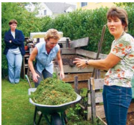
Im Kompostierkurs geben die Kompostberaterinnen hilfreiche Tipps zu Kompostpflege, Komposteinsatz und Rasenkompostierung.

Besuchen Sie unsere beliebten und sehr informativen kostenlosen Kompostierkurse! Unsere praxisorientierten Kompost- und Gar-