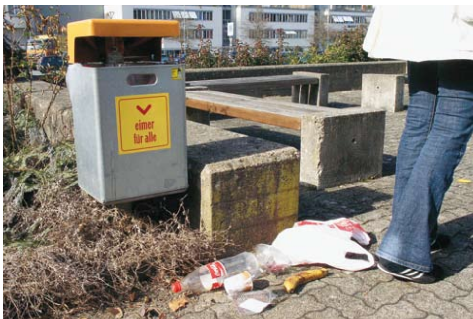
Seit dem 1. Januar 2008 gilt im Thurgau das neue Littering-Verbot: Das achtlose Wegwerfen von Verpflegungs-Abfällen kann teuer werden!

Untersuchungen zeigen, dass ein Zusammenhang zwischen dem Ausmass von Littering und dem Sicherheitsempfinden der Passanten existiert. Ordnung vermittelt das Gefühl von Sicherheit – und für Sicherheit und Ordnung ist die Polizei zuständig. Die Bestimmungen im Abfallgesetz geben der Polizei die nötigen gesetzlichen Grundlagen, um auf öffentlichen Plätzen auch in dieser Hinsicht für Ordnung zu sorgen. Wo bereits viel Abfall herumliegt, wird noch mehr hingeworfen. Meist handelt es sich dabei um Überreste der «fliegenden» Verpflegung, die nicht selten neben halb leeren Abfallkübeln auf dem Boden landen. Umfragen zeigen, dass in einer unpersonlichen Umgebung mehr gelittert wird als in «Wohlfühlgegenden». Dies macht deutlich, dass kein Gesetz der Welt allein dieses