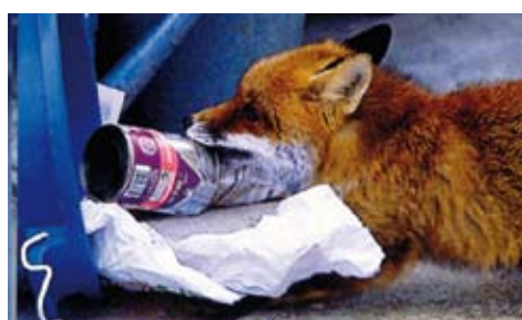
«Lueged numä, dä Fuchs goht umä ...» Kehrriichtsäcke erst am Abfuhrtag bereitstellen – danke!

Kommt dann die Kehrriichtabfuhr, liegt neben der zerfetzten «Kehrriichtsackleiche» jede