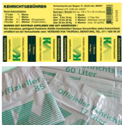
Die offiziellen Gebührenträger der KVA Thurgau.

Die Verkaufsstellen werden in der Woche 25 von den alten Preisen auf die neuen Preise umstellen. Für die Benutzer gilt es Folgendes zu beachten: