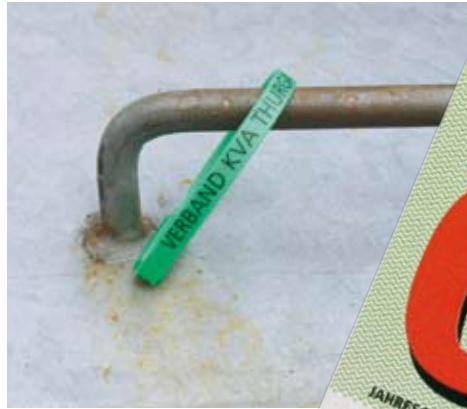
Plombe für eine Leerung

Bitte beachten Sie auch die Hinweise und Bestimmungen im Informationsblatt «Kehrichttarif für den Sammeldienst» auf Seite 3. Trennen Sie es entlang der Perforation ab und bewahren Sie es auf – danke!