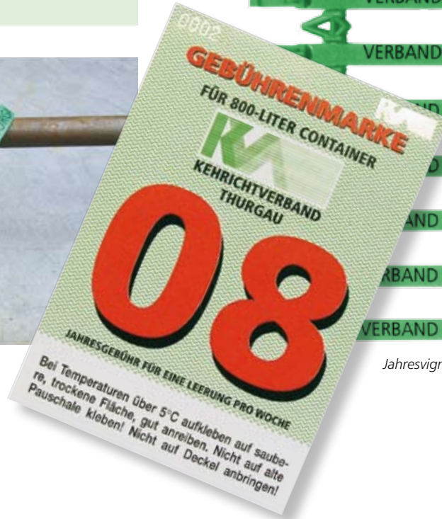
Jahresvignette und Plomben für 800-Liter-Gewerbe- und Industriecontainer