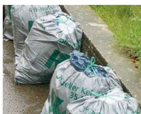
Gut, dass diese nassen Säcke keine Marken brauchen.