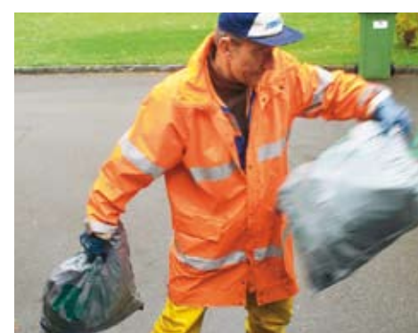
Die Entsorgung geht schneller von der Hand, da Gebührenkehrriichtsäcke nicht auf ihre Frankierung geprüft werden müssen.