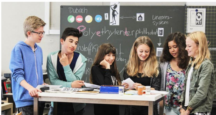
Sich Wertstoffkreisläufen bewusst zu sein, ist der erste Schritt, Ressourcen zu schonen

Als Pusch 2003 das Konzept für den Abfall- und Konsumunterricht vorstellte, war für den Verband KVA Thurgau schnell klar, dass er das Vorhaben unterstützen will. Zusätzlich zum damaligen Unterrichtsangebot profitieren Primarschulen seit 2018 vom Unterricht «Energie und Klima». Denn verantwortungsbewusste Kehrrichtverwertungsunternehmen produzieren heute umweltverträgliche Energie.