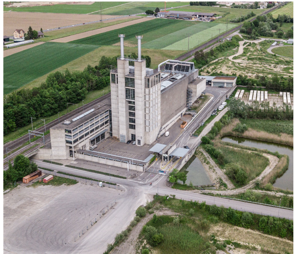
Die neue KVA soll auf dem Areal rechts direkt neben der heutigen Anlage gebaut werden. Als Ausgleich für den dortigen Naturraum wird weiter südlich ein rund doppelt so grosses Amphibienschutzgebiet geschaffen.

Die KVA kann schon heute viel mehr als «nur» Abfall verbrennen. 2019 haben wir unseren Kunden 236 GWh CO 2 -neutrale Energie geliefert. Die Model AG in Weinfelden nutzt unsere Wärme in der Papier- und Kartonproduktion und stellt mit unserem Dampf selber Strom her. Die Nutzung von Abwärme – zum Beispiel aus KVA – ist ein Standbein der Energiestrategie 2050 des Bundes. Hier wollen und können wir einen bedeutenden Beitrag leisten: für das Klima, aber auch für den Thurgau. In der Wirtschaft steigt der Bedarf an